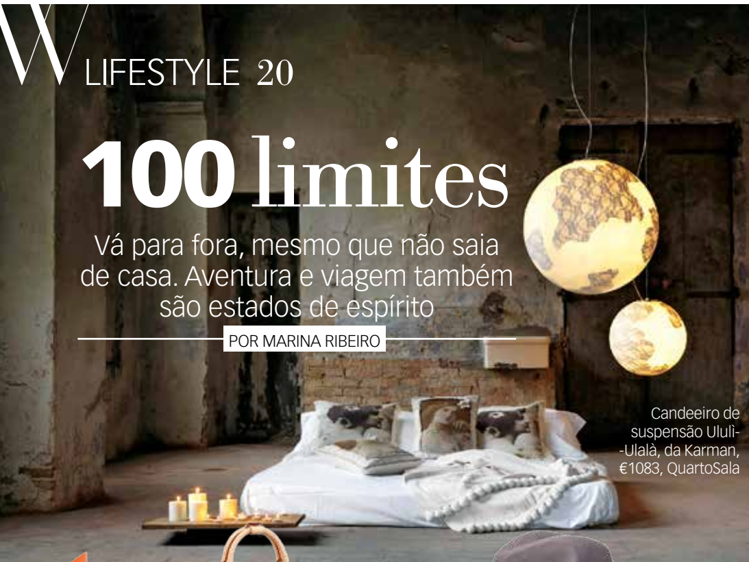
Candeeiro de suspensão Ululi-Ululã, da Karman, €1083, QuartoSala