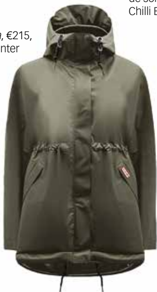
Parka, €215, Hunter