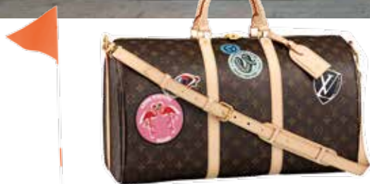
Saco, €1530, Louis Vuitton