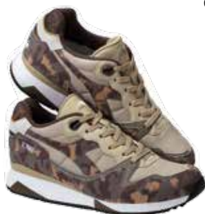
Tênis, €125, Diadora