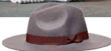
Chapéu, €39,95, United Colors of Benetton