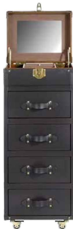
Camiseiro Britannia (alt. 116,50 x larg. 51 x prof. 41 cm), €688, Area