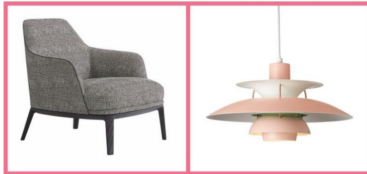
Quarto e Sala

O Stock-Off da Quarto e Sala decorre até 20 de novembro. As lojas do Príncipe Real e de Paço de Arcos vão estar com reduções que podem chegar aos 80%.