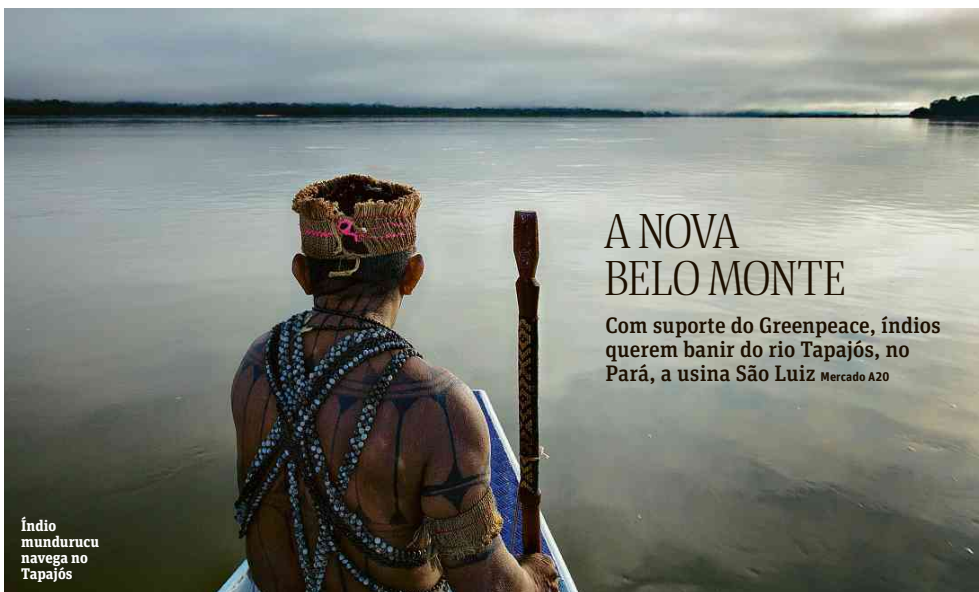
Índio mundurucu navega no Tapajós