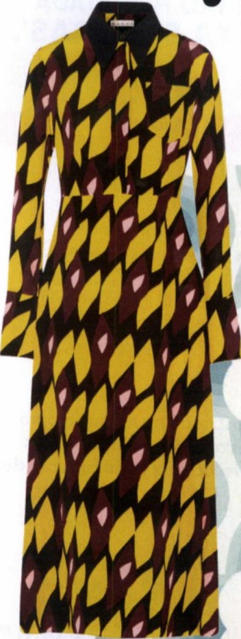
Vestido Marni, no Net-a-Porter, €1390.