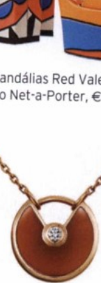
Colar Amulette, da Cartier, preço sob consulta.