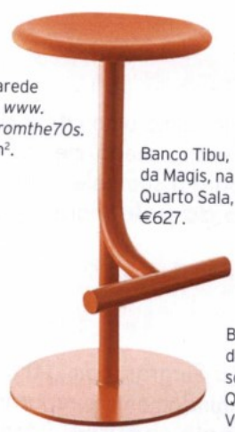
Banco Tibu, da Magis, no Quarto Sala, €627.