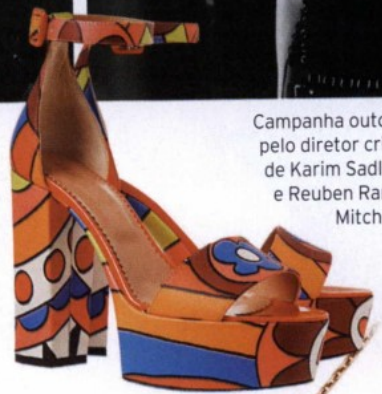
Sandálias Red Valentino, no Net-a-Porter, €410.