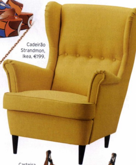
Cadeirão Strandmon, Ikea, €199.