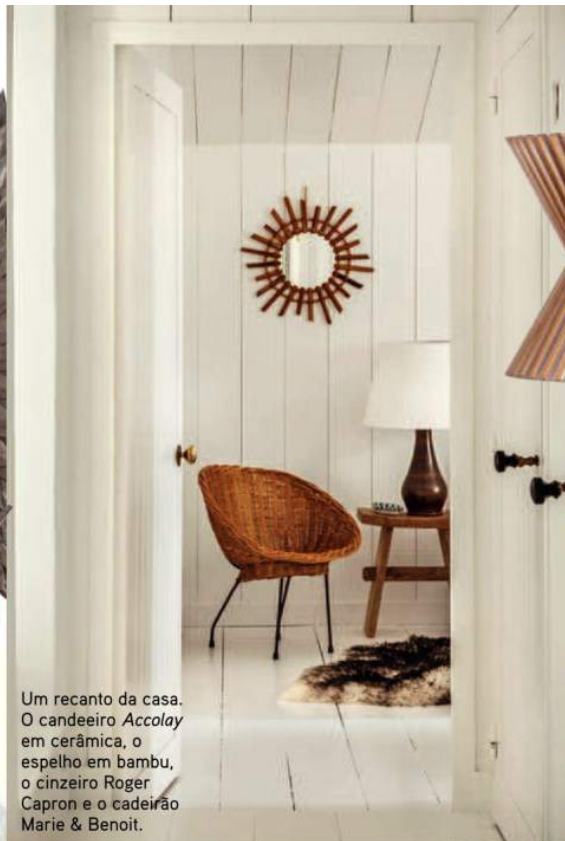
Um recanto da casa. O candeeiro Accolay em cerâmica, o espelho em bambu, o cinzeiro Roger Capron e o cadeirão Marie & Benoit.