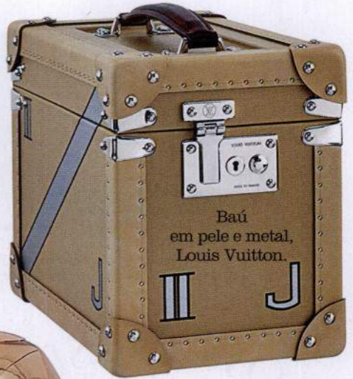
Baú em pele e metal, Louis Vuitton.