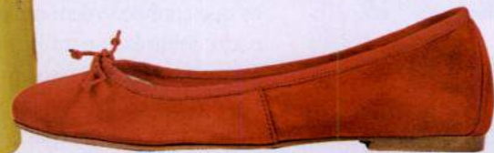
Bailarinas em camurça, € 59,90, Zilian.