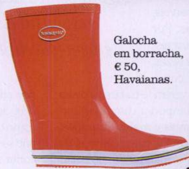
Galocha em borracha, € 50, Havaianas.

Ideias para compras com CARINHO extra, para um Natal repleto de surpresas especiais.