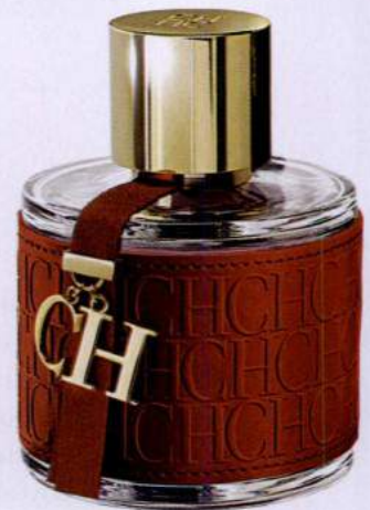
CH Eau de Toilette, 50ml, € 72, Carolina Herrera.