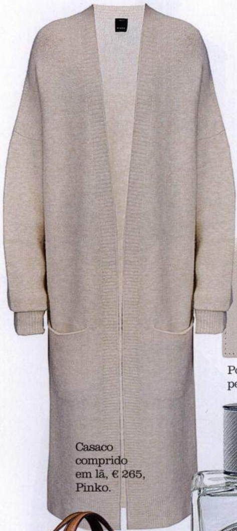
Casaco comprido em lã, € 265, Pinko.