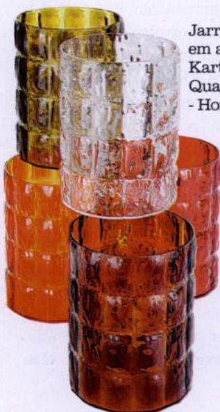
Jarras Matelassé em acrílico, Kartel, € 85, QuartoSala - Home Culture.

Ideias para compras com CARINHO extra, para um Natal repleto de surpresas especiais.