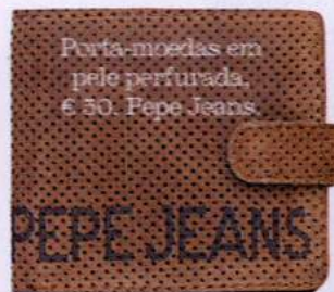
Porta-moedas em pele perfurada, € 50, Pepe Jeans.