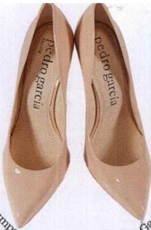
Pumps em verniz, € 310, Pedro Garcia.