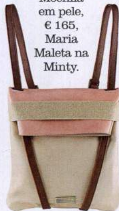
Mochila em pele, € 165, Maria Maleta na Minty.