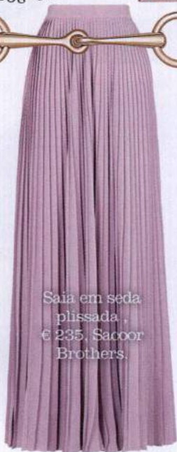
Saia em seda plissada, € 235, Sacoor Brothers.