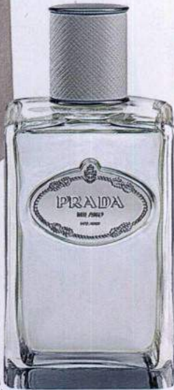
Infusion D'Homme, 200ml, € 105, Prada.