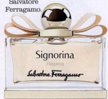
Signorina Eleganza, 100ml, € 109, Salvatore Ferragamo.