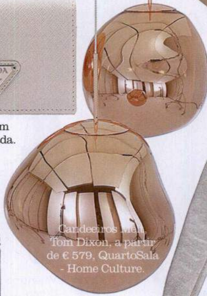
Candeeiros de Tom Dixon, a partir de € 579, QuartoSala - Home Culture.