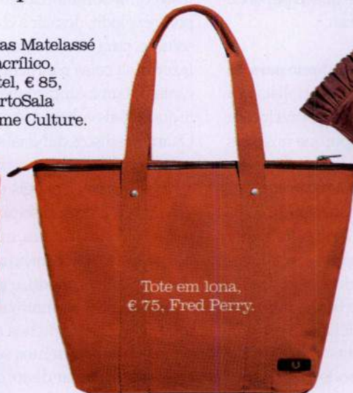
Tote em lona, € 75, Fred Perry.