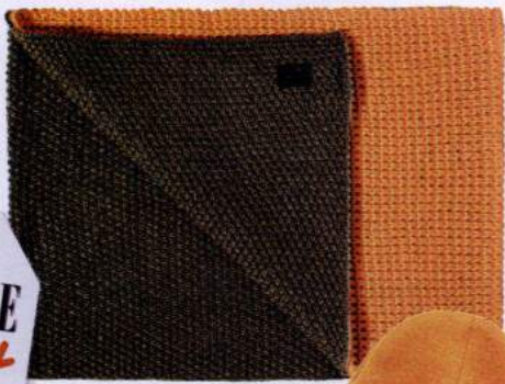
Cachecol e gorro em lã, € 79,90, G-star Raw.