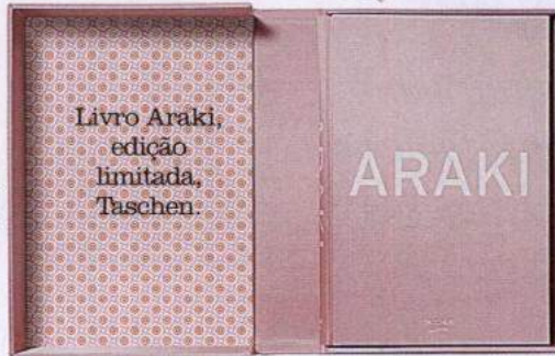
Livro Araki, edição limitada, Taschen.