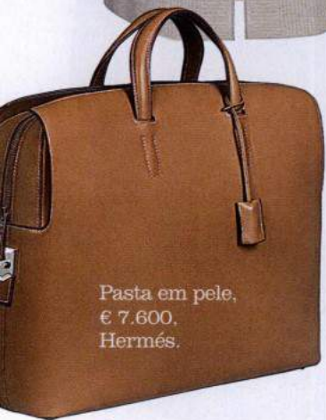
Pasta em pele, € 7.600, Hermès.