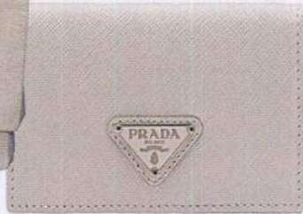
Porta-moedas em pele, € 230, Prada.