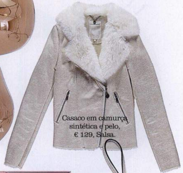
Casaco em camurça sintética e pelo, € 129, Salsa.