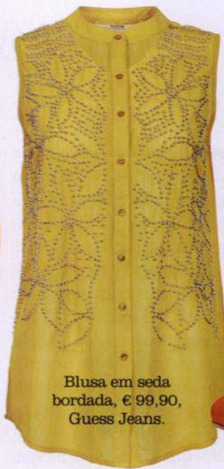
Blusa em seda bordada, € 99,90, Guess Jeans.