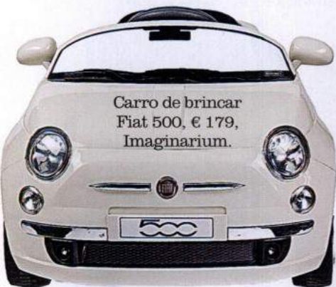
Carro de brincar Fiat 500, € 179, Imaginarium.