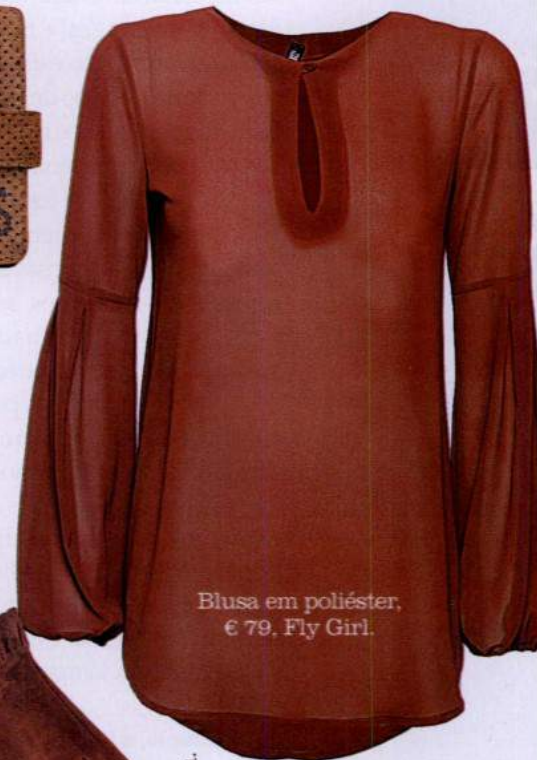
Blusa em poliéster, € 79, Fly Girl.