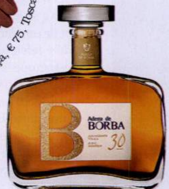
Aguardente Vínica 30 anos, € 69, Adega de Borba.