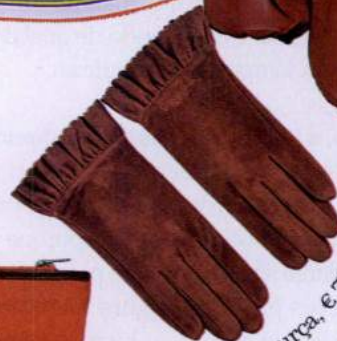
Luvas em camurça, € 75, Tosca Blu.