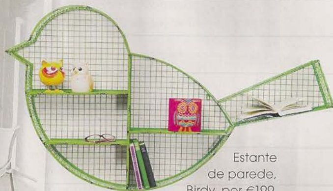
Estante de parede, Birdy, por €199, à venda na Kare Design.