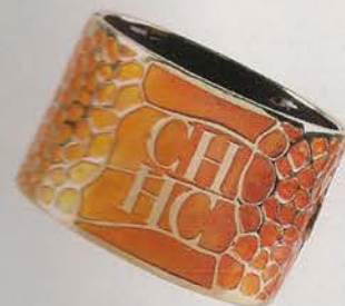
Pulseira, €90, na Carolina Herrera.