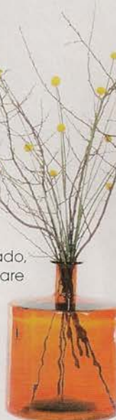
Frasco em vidro reciclado, €78,95, na Kare Design.

COORDENAÇÃO: ESMERALDA COSTA