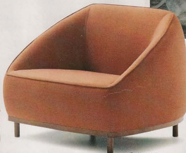
Poltrona, da Sancal, €911 (em tecido), na Quarto Sala.