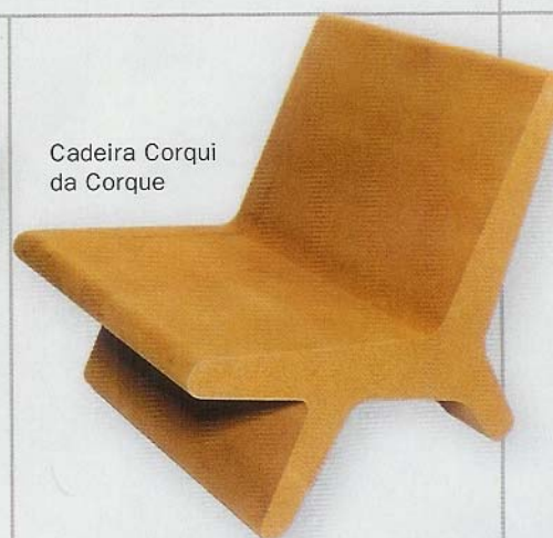
Cadeira Corqui da Corque