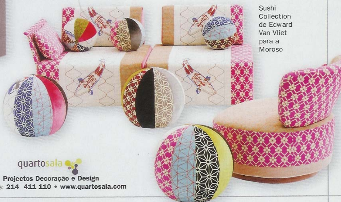
Sushi Collection de Edward Van Vliet para a Moroso