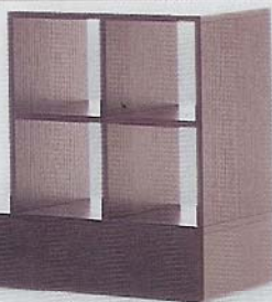
Colecção Cuvert da Cor