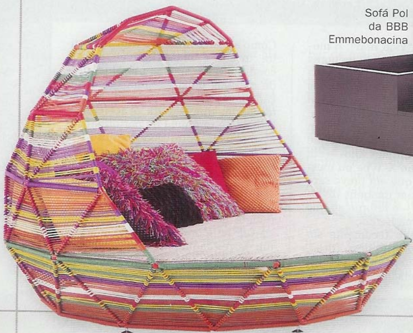
Sofá Pol da BBB Emmebonacina

Marcas, designers e profissionais do mobiliário e iluminação de interiores distribuíram as atenções pelos quatro salões: O Salão Internacional do Móvel, o Salão Internacional de Iluminação (Euroluce), o Salão Internacional de Acessórios de Decoração e o Salão Satélite. O I Saloni foi visitado por 315 mil pessoas. ■