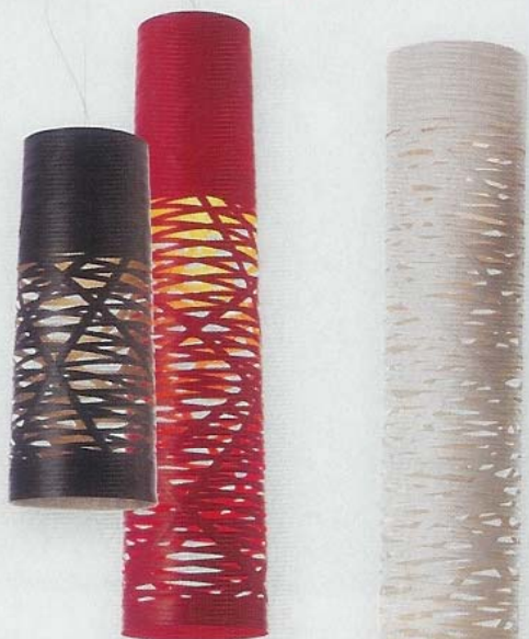
Colecção Tress de Marc Sadler para a Foscarini