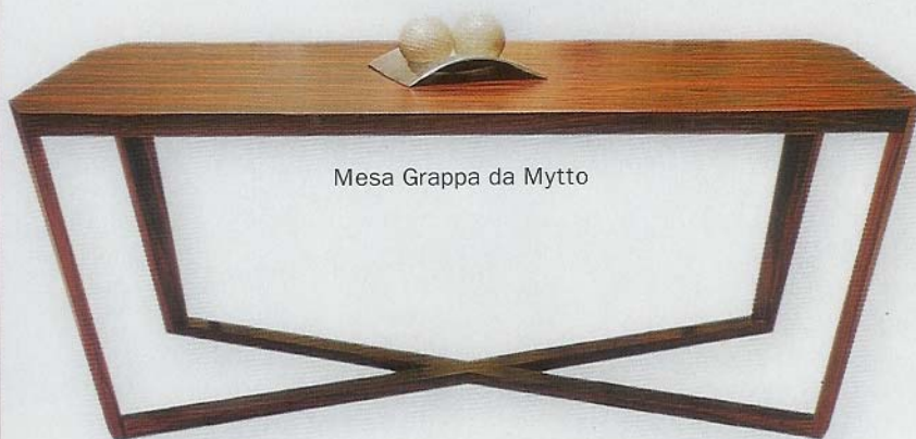
Mesa Grappa da Mytto