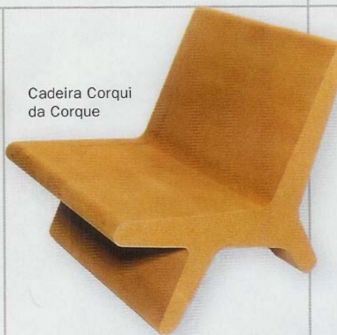
Cadeira Corqui da Corque