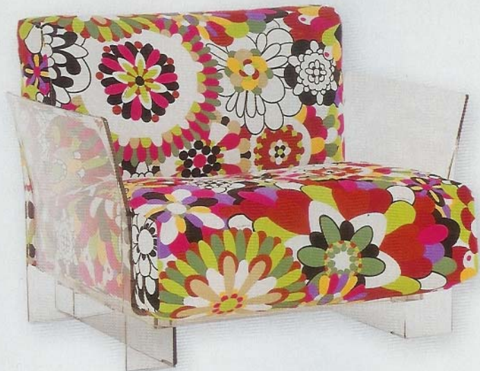
Poltrona Pop Missoni, de Piero Lissoni para a Kartell

Cosmic Leaf de Ross Lovegrove para a Artemide