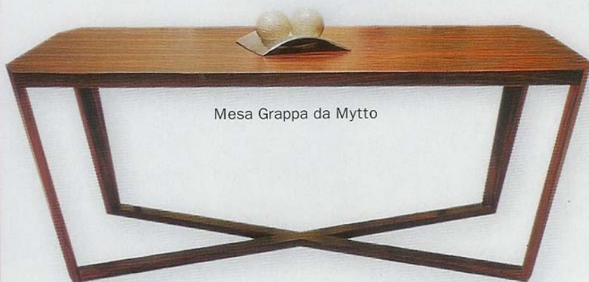
Mesa Grappa da Mytto